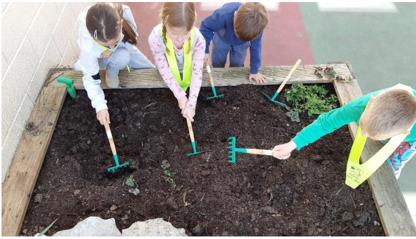
Na vrtičku so pridno rastle zelišča (meta, melisa, drobnjak, bazilika) in črna redkev.